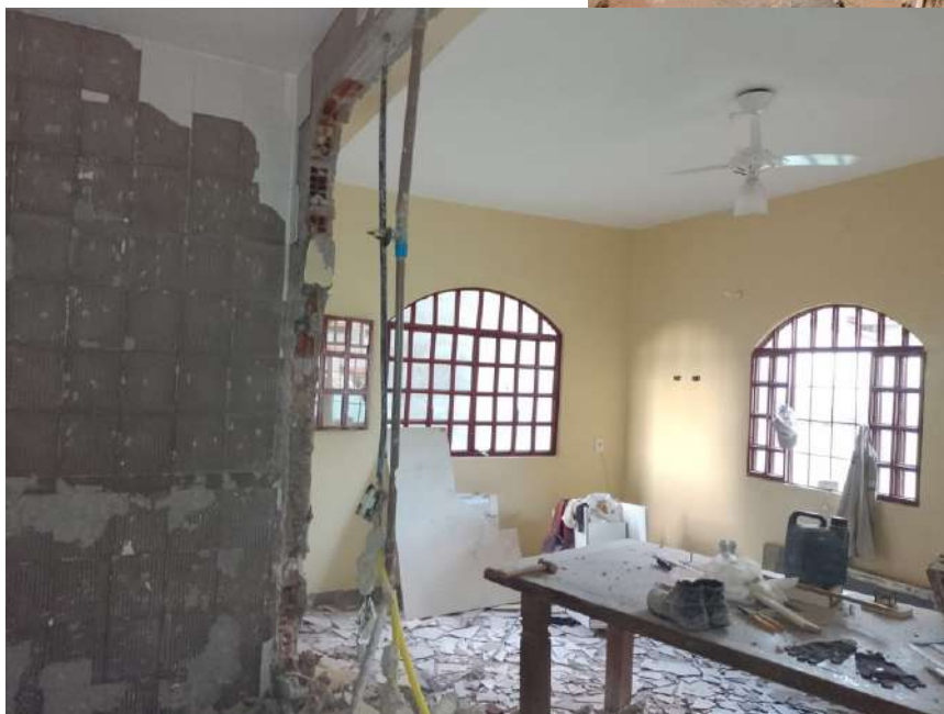
Reforma e ampliação da cozinha - Antes