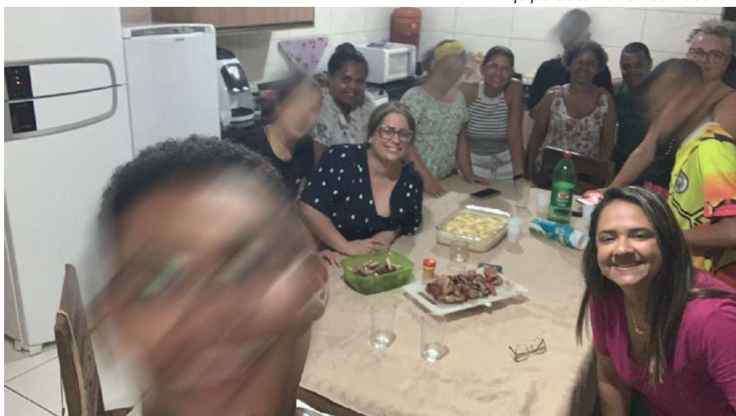
Equipe Casa Lar e Acolhidos

Registro da confraternização entre acolhidos, equipe técnica e educadores, realizada, em dezembro de 2023. O momento foi de gratidão e descontração, marcou o encerramento do ano e das atividades realizadas neste período.