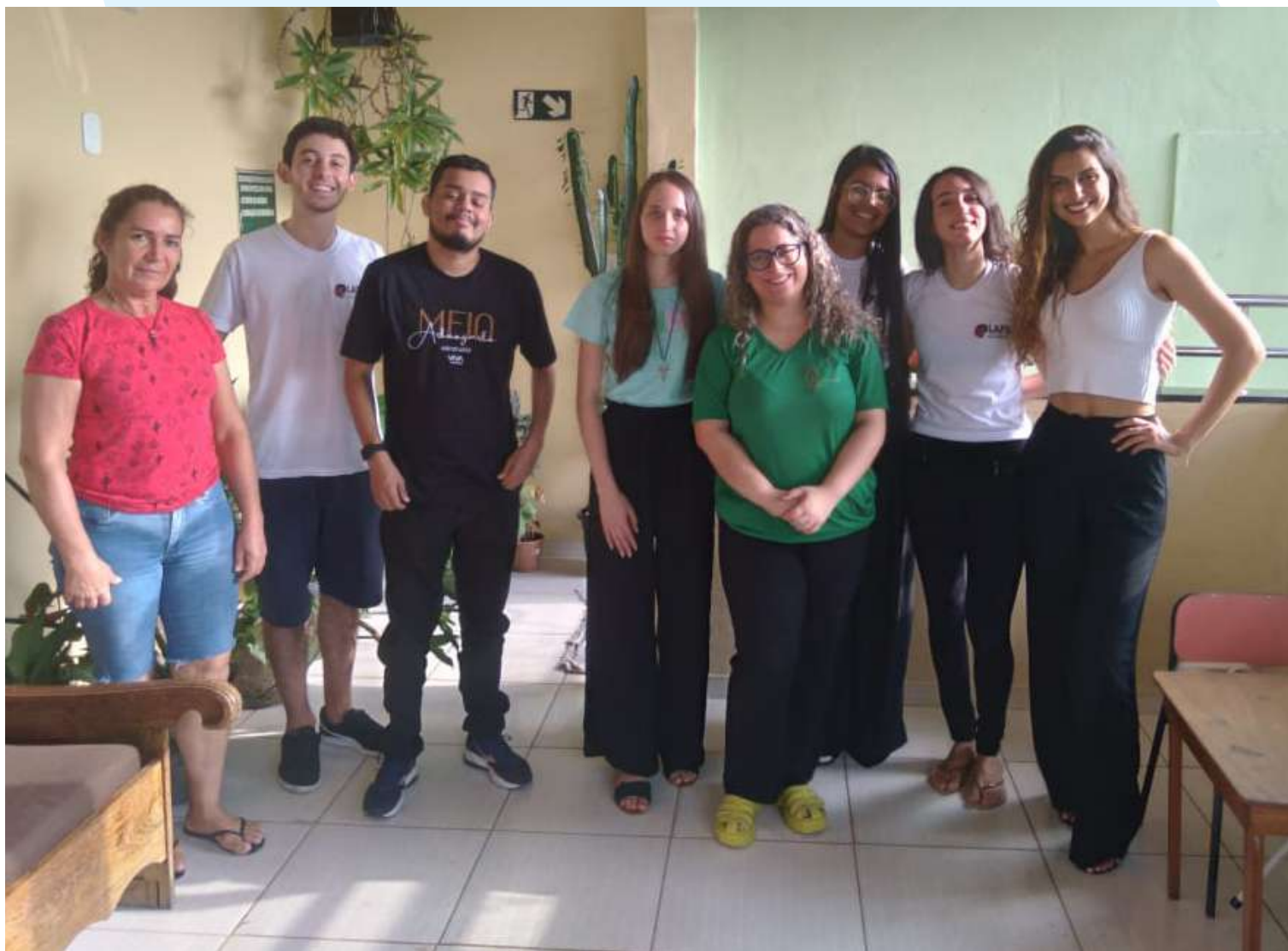
Alunos de direito da UFJF e a assistente social em visita a casa

A Universidade Federal de Juiz de Fora - UFJF, através dos alunos do curso de Direito e Medicina, realizou uma visita na casa lar, proporcionando um momento com os adolescentes sobre a higiene do sono. Os universitários abordaram os cuidados e a importância de se ter um sono de qualidade visando à rotina de vida saudável. Atualmente, os alunos, que fazem parte do Núcleo de Estudos e Extensão Juventude e Sociedade - NEJUS, têm sido nossos parceiros, de forma mensal, no desenvolvimento de rodas de conversas sobre vários temas para nossos acompanhados e equipe da casa lar. Além disso, articulam o acesso das crianças e adolescentes que estão em situação de acolhimento a vários serviços de saúde.