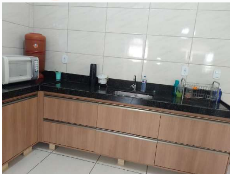
Reforma e da pia e bancada da cozinha - Depois