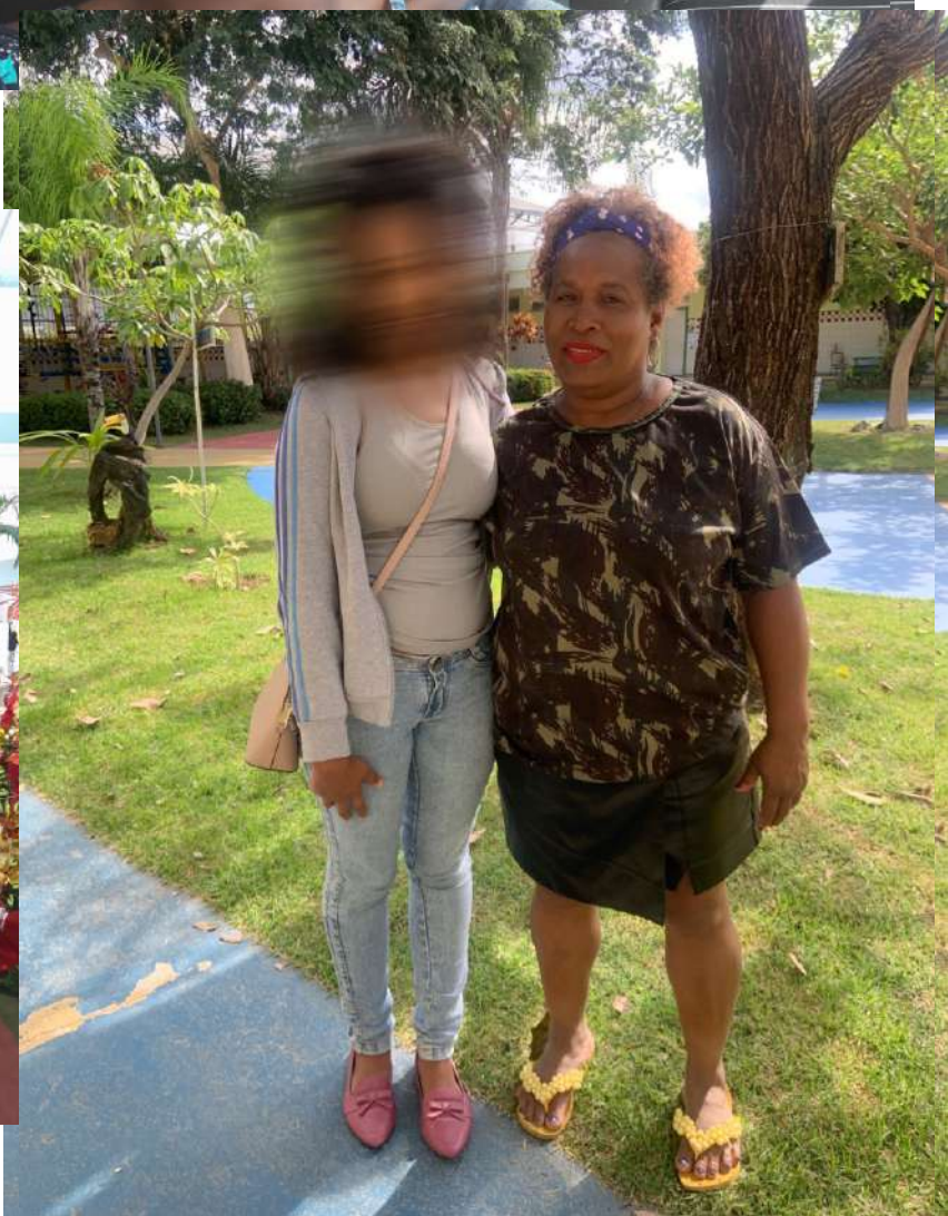
Pâmela e sua tia paterna em fortalecimento de vínculo.